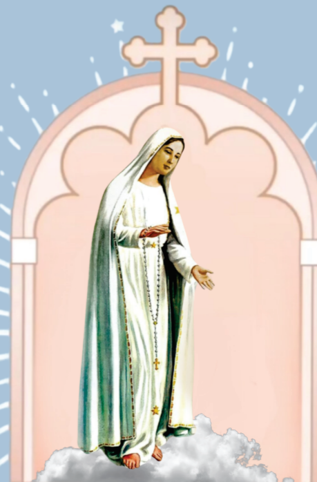
Nossa Senhora de Fátima