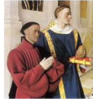
Monjes Da Época Bizantina

Hoje é possível identificar a classe do texto preservado em manuscritos do Novo Testamento ao comparar suas características textuais com as citações dessas mesmas passagens nos escritos dos pais da Igreja, que viviam nos principais centros eclesiásticos, ou próximo a eles. Ao mesmo tempo, as peculiaridades do texto local tendiam a diluir-se e mesclar-se com outras classes de texto. Por exemplo, um manuscrito do Evangelho segundo Marcos copiado em Alexandria e levado logo à Roma exerceria, sem dúvida, alguma influência nos copistas que transcreviam o texto de Marcos que era corrente em Roma. Entretanto, durante os primeiros séculos, as tendências para desenvolver e preservar um tipo particular de texto, prevaleceram sobre a mescla dos mesmos. Dessa maneira, se formaram vários tipos de texto do Novo Testamento, os mais importantes dos quais, são o Alexandrino, o Ocidental, o Cesariense e o Bizantino.