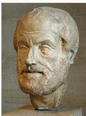
Busto de Aristóteles no Museu do Louvre .

Aristóteles (em grego Αριστοτέλης ) nasceu em Estagira , na Calcídica (384 a.C. - 322 a.C.). Filósofo grego , aluno de Platão e professor de Alexandre, o Grande , é considerado um dos maiores pensadores de todos os tempos e criador do pensamento lógico .