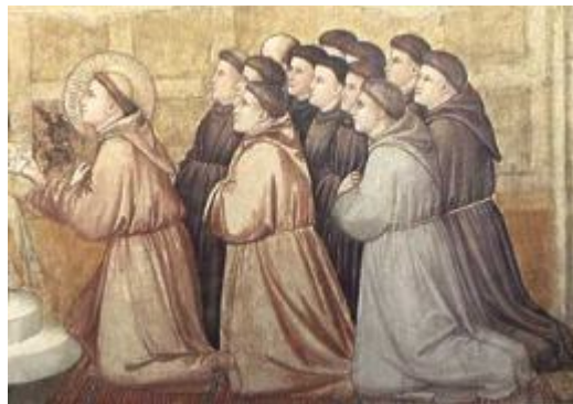
Monjes Da Época Bizantina

É usualmente considerado como o melhor e mais fiel na preservação do original. Suas características são a brevidade e a austeridade. Isto é, o Alexandrino é geralmente mais curto que outras classes de texto, e não exhibe o grau de esmero gramatical e estilística que caracterizam o tipo de texto Bizantino e em menor grau o tipo de texto Cesariense.